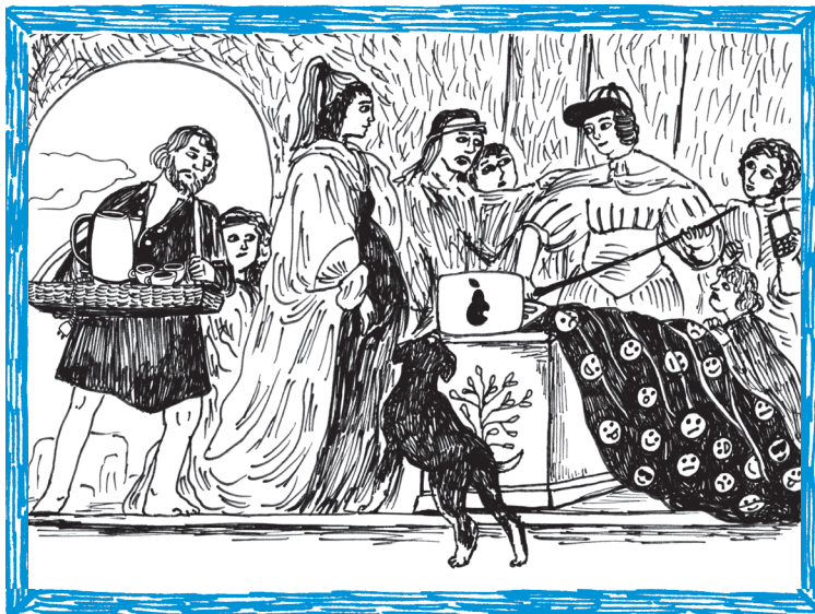
Jian de Braij, Achilles wśród córek Likomedesa, 1664

Achilles to jeden ze starożytnych herosów, którego bardzo słabym punktem była pięta. Tetyda, jego matka, chciała zapobiec udziałowi Achillesa w wojnie trojańskiej i ukryła go wśród córek króla Likomedesa. Został nawet przebrany w damskie szaty. Jednak kiedy przybył Odyszeusz, przebrany za handlarza, Achilles, jako jedyny z dziewcząt, z oferowanego towaru wybrał broń. I tak jego przebranie przestało być tajemnicą. Na obrazie holenderskiego malarza Jana de Braija bohaterowie mają XVII-wieczne stroje. My postanowiliśmy dodać do tej antycznej historii pięć współczesnych elementów. Spróbuj je odnaleźć.