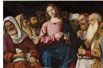
Sala 207 Chrystus wśród doktorów Cima da Conegliano Opowiada: Wioleta Więctaw