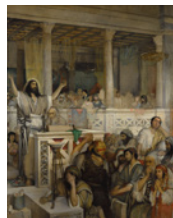
Sala 105 Chrystus nauczający w Kafarnaum Maurycy Gottlieb opowiada: Monika Świderska